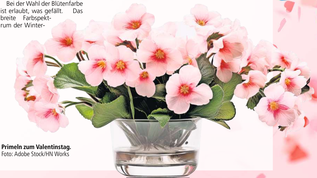
Primeln zum Valentinstag.