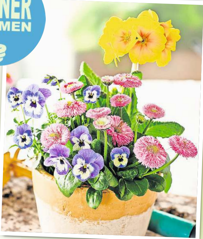
Pflegeleichte Trios bereichern jedes Zuhause mit blühendem Frühlingsglanz.