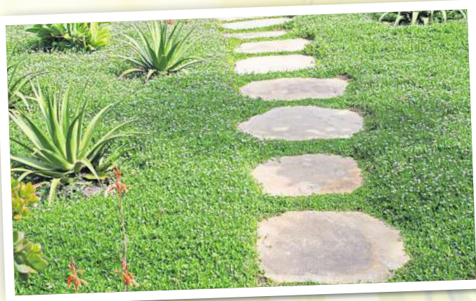
Für viele eine gute Lösung: Bodendecker.