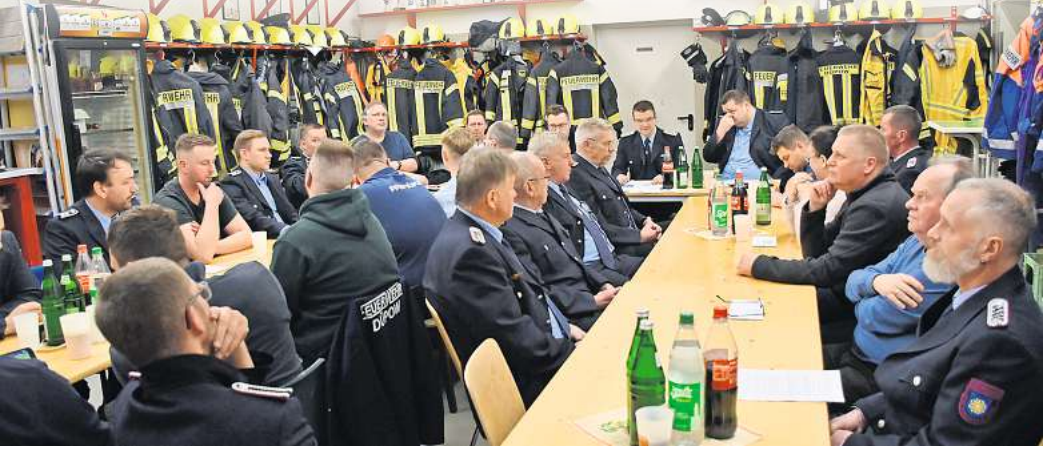
Viele Auszeichnungen und Beförderungen gab es bei der Jahreshauptversammlung der Freiwilligen Feuerwehr Düpow.