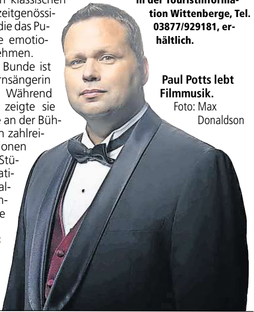
Paul Potts lebt Filmmusik.

Der Vorverkauf für die Elblandfestspiele 2024 ist bereits im Gange. Karten sind online unter www.elblandfestspiele.de sowie in der Touristinformation Wittenberge, Tel. 03877/929181, erhältlich.