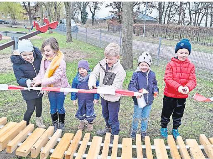
Kinder aus dem Perleberger Ortsteil Düpow durchschneiden das symbolische Band zur Freigabe ihrer neuen Spielgeräte.