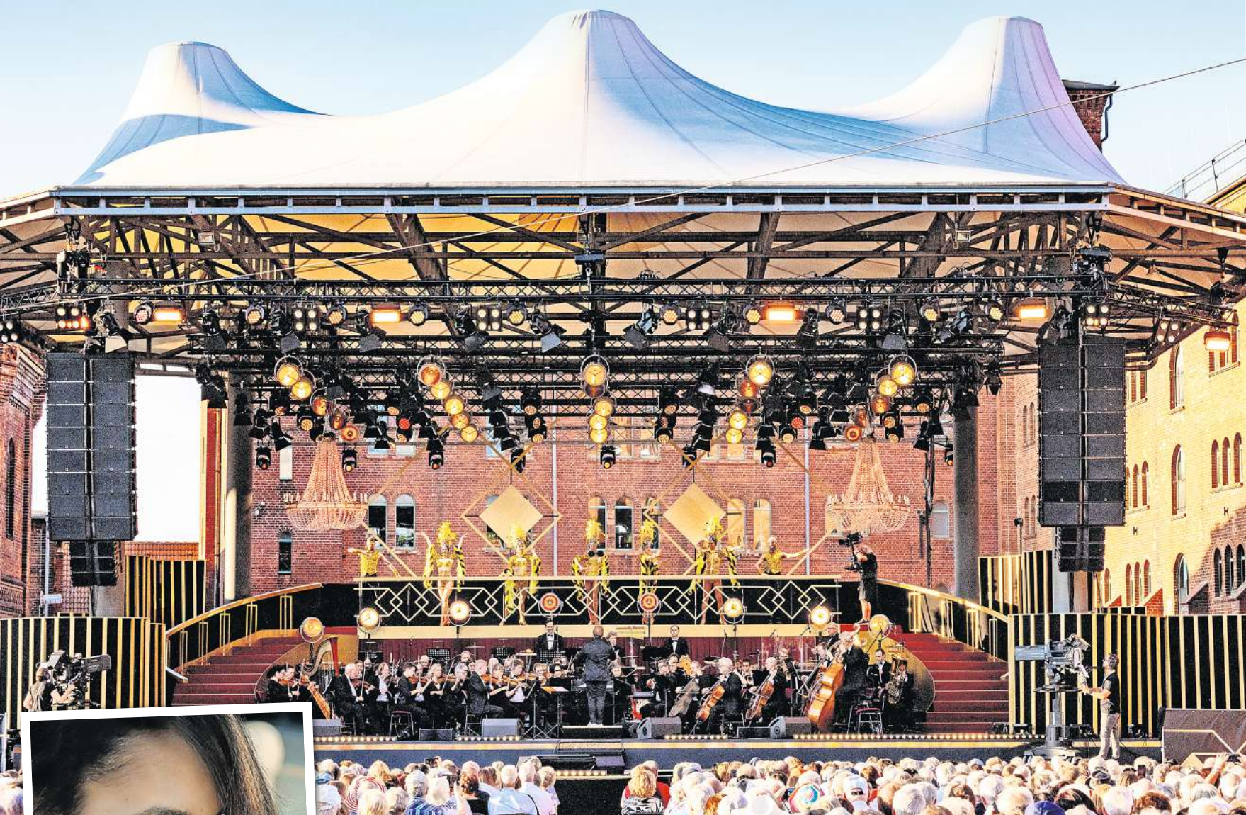
Die Elblandfestspiele 2023 standen unter dem Motto „The Golden River – Classics der 20er Jahre“.

Paul Potts und Cassandra Steen kommen zu den Elblandfestspielen