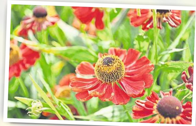
Bewährte Leuchtkraft: Die Sonnenbraut Baudirektor Linne ist mit samtroten und gelb geflammten Blüten ein Hingucker.