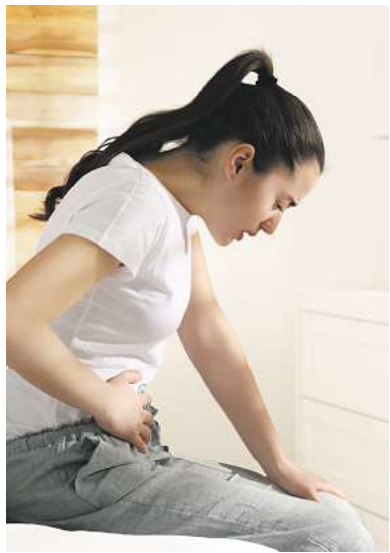
Wiederkehrende Darmbeschwerden wie Durchfall, Bauchschmerzen und Blähungen können die Lebensqualität Betroffener stark einschränken.

auch einzeln auftreten können und in ihrer Intensität, Häufigkeit und Dauer variieren. Für Betroffene stellt dies eine erhebliche Belastung im Alltag dar, die die Lebensqualität stark