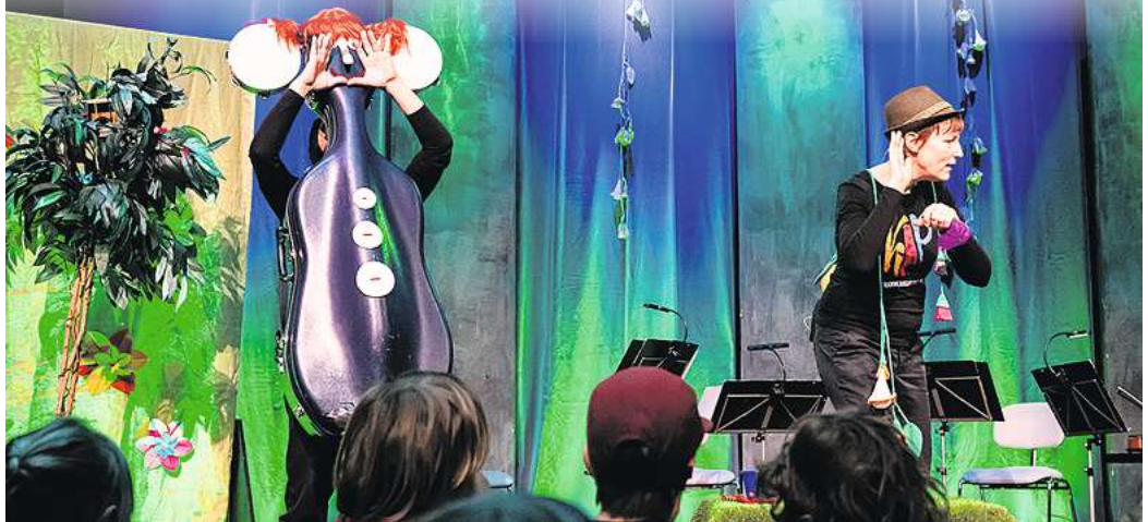
Ein Familienkonzert mit Kapellina, dem Familienkonzert-Maskottchen der Kammerakademie Potsdam (KAP) gibt es am 1. Mai in Rheinsberg.

• Tickets: Musikkultur Rheinsberg (Mo. bis Fr. 10 bis 15 Uhr), online: www.schlosstheater-rheinsberg.de , Tel. 033931/72117. Tourist-Information Rheinsberg Tel. 033931/34940, E-Mail: info@tourist-information-rheinsberg.de