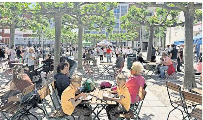
Auch dieses Jahr soll es wieder viel Spaß auf dem Paul-Lincke-Platz machen: das Wittenberger Kinderfest.

der. Für Pommes, Bratwurst und Softgetränke sorgt die Vorkamp KochKultur GmbH aus Perleberg. Das Biosphärenreservat Flusslandschaft Elbe beteiligt sich mit einem Ratespiel rund um den Apfel – von Schneewittchen bis Wilhelm Tell. Das Stadtmuseum ist mit einer Ritterburg dabei. Verschiedene Bastelaktionen zum Thema Märchen, Kinderschminken und eine Fotoaktion des Jugendforums runden den Nachmittag ab. Getreu dem Motto des diesjährigen märchenhaften Kinderfestes sind alle Gäste und Mitwirkende aufgefordert, sich zu verkleiden. WS