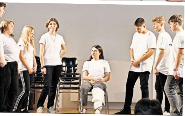
Szene aus der Aufführung des „Fliegenden Klassenzimmers 2.0“ im vergangenen Jahr in Pritzwalk.