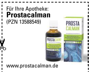
Abbildung Betroffenen nachempfunden PROSTACALMAN. Wirkstoffe: Serenoa repens a, Pareira brava a, Populus tremuloides Dill. DZ. Prostacalman wird angewendet entsprechend den homöopathischen Arzneimittelbildern. Dazu gehören: Blasenentzündungen und Beschwerden beim Wasserlassen, bei vergrößerter Prostata. www.prostacalman.de • Zu Risiken und Nebenwirkungen lesen Sie die Packungsbeilage und fragen Sie Ihre Ärztin, Ihren Arzt oder in Ihrer Apotheke. • PharmaSGP GmbH, 82166 Gräfelfing

Häufiger Harndrang, der Urin kommt nur noch tropfenweise oder die Blase fühlt sich nicht entleert an? Schuld daran ist oft die Prostata. Dieses sogenannte „Männerorgan“ kann mit zunehmendem Alter wachsen und dadurch die Harnröhre blockieren. Experten haben ein Arzneimittel namens Prostacalman entwickelt, das gleich drei Wirkstoffe in sich vereint: Serenoa repens, Pareira brava und Populus tremuloides. Diese Arzneistoffe sind dafür bekannt, u.a. den nächtlichen Harndrang zu reduzieren, den Urinfluss zu verstärken und den Restharn in der Blase zu verringern. Genial: Prostacalman beeinträchtigt nicht die Sexualfunktion. Das Arzneimittel ist rezeptfrei in jeder Apotheke erhältlich.