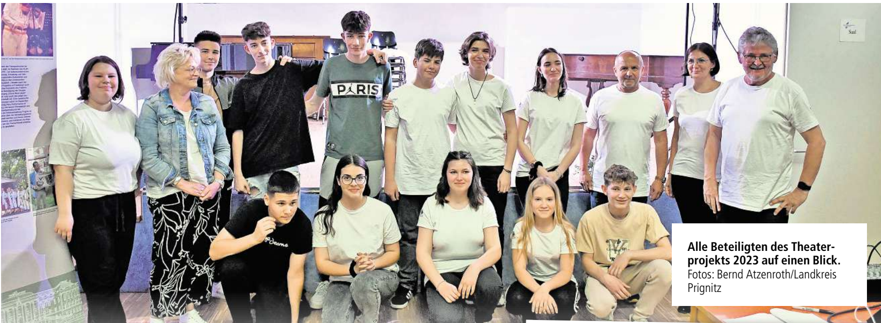
Alle Beteiligten des Theaterprojekts 2023 auf einen Blick.

schlussfassungen soll laut Veranstalter an diesem Tag auch wieder rege diskutiert werden. Aus diesem Grund werden alle Gartenfreunde des Vereins zur Teilnahme aufgefordert. Die Mitgliederversammlung findet in der AWO-Begegnungsstätte in der Perleberger Straße statt. WS