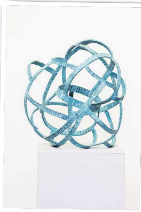
Mediterrane Wetterkarte 1987 des Künstlers Per Gulden.

der Vernissage am 15. Juni um 15 Uhr vor Ort. Weitere Ausstellungen im Rahmen des „Kunstsommers“ sind in Vorbereitung. Der Eintritt zur Ausstellung ist frei. Der Förderverein freut sich über Spenden. dre