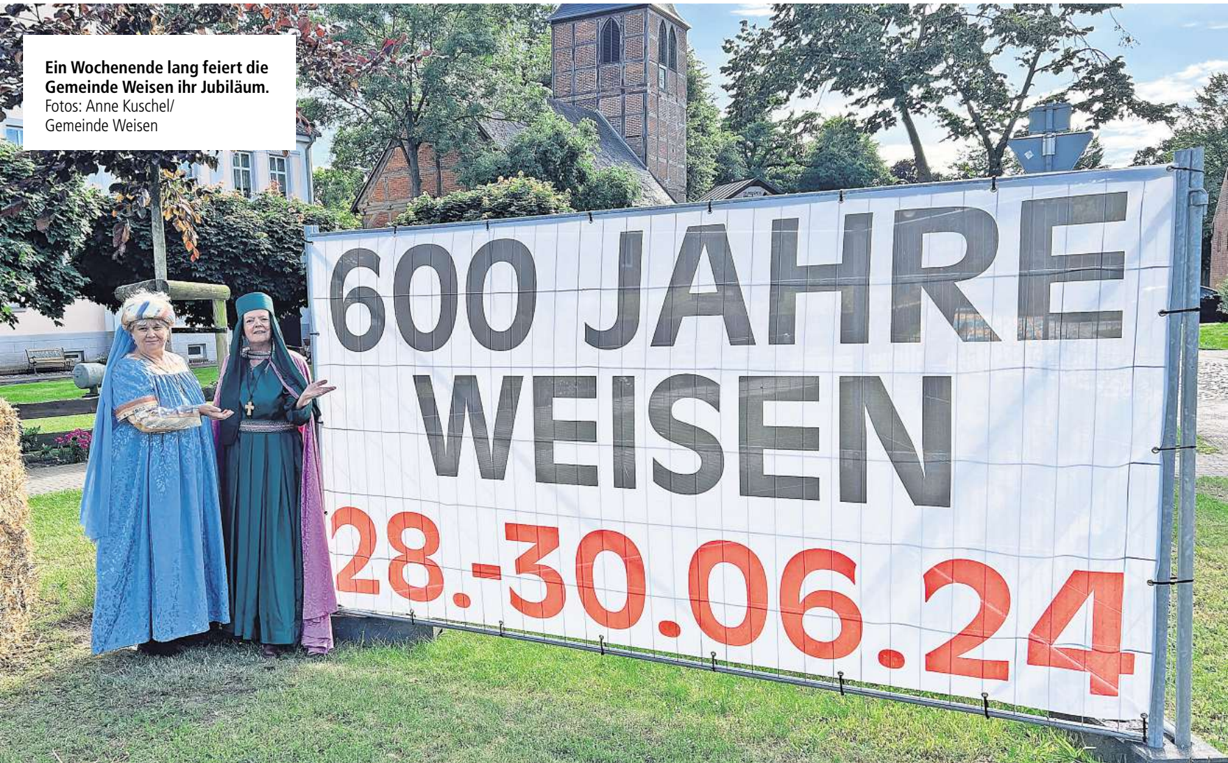
Ein Wochenende lang feiert die Gemeinde Weisen ihr Jubiläum.