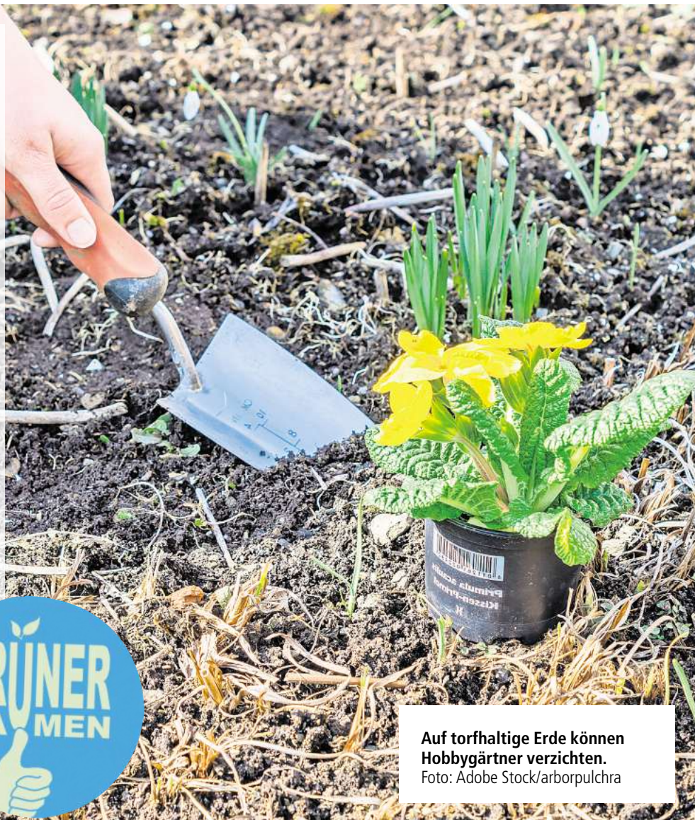
Auf torfhaltige Erde können Hobbygärtner verzichten.

gut speichern können. Mit einer Umstellung der Pflegegewohnheiten kann aber ein ähnlicher gärtnerischer Erfolg erzielt werden. Bei Verwendung torffreier Erden ist es besonders wichtig, gerade direkt nach dem Um- oder Ausstopfen darauf zu achten, dass die Pflanzen regelmäßig mit Wasser versorgt werden. In der Regel bestehen torffreie Erden aus einer Mischung von Kompost, Holzfasern, Rindenhumus und Kokosmark. Auf den Säcken mit torffreier Gartenerde sind die Ausgangsstoffe in der Reihenfolge ihres Anteils genannt. Auch andere Roh- und Reststoffe wie Faserhanf, Hopfenrebenhäcksel oder Chinaschilf werden derzeit auf ihre Eignung für Gartenerden getestet. net