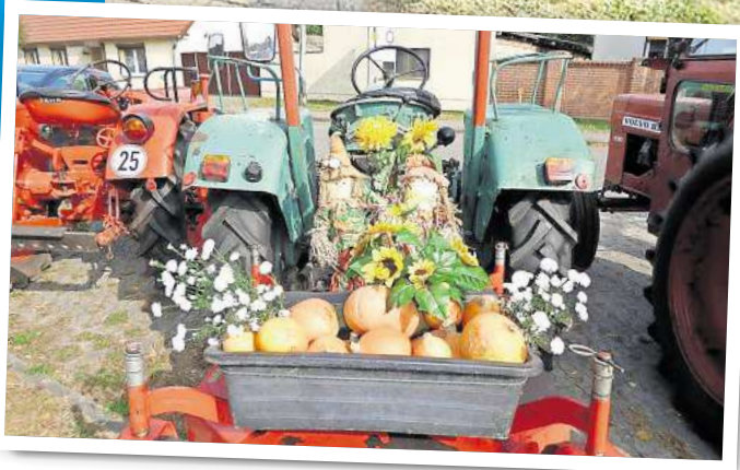
Das Dorf feiert: Mit Traktoren und vielen Vergnügungen für Groß und Klein.

Die Heimatstube findet man in der Wilhelm-Pieck-Straße 57. Das ehemalige Bauerngehöft zeigt Ausstellungen zur Dorfgeschichte: eine zeitgeschichtliche