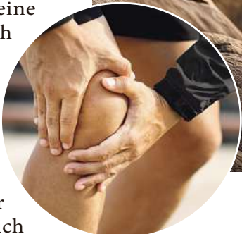
Das CBD Gel enthält Menthol und Minzöl für beanspruchte Muskeln.