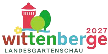
Die Laga 2027 kann kommen.