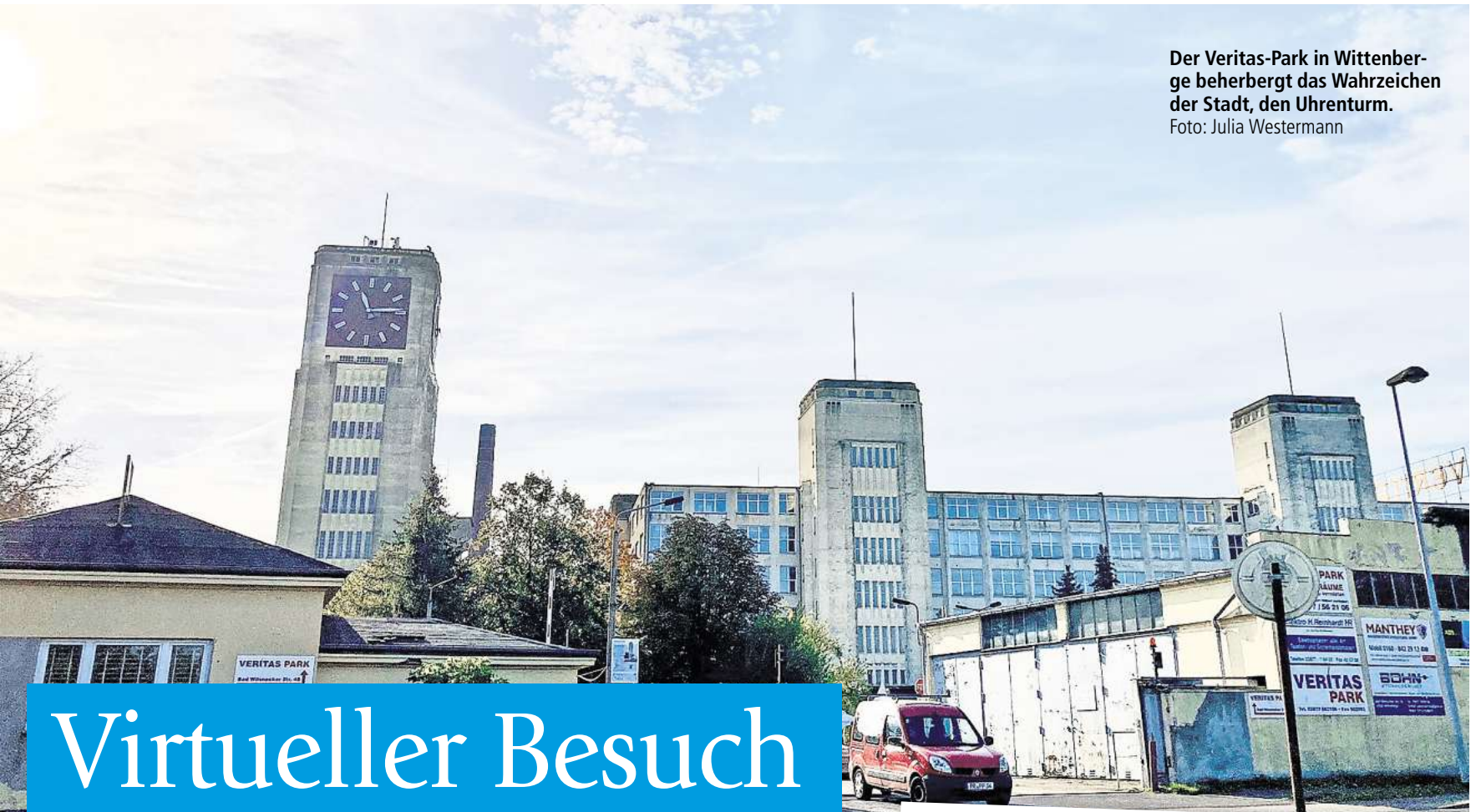
Der Veritas-Park in Wittenberge beherbergt das Wahrzeichen der Stadt, den Uhrenturm.