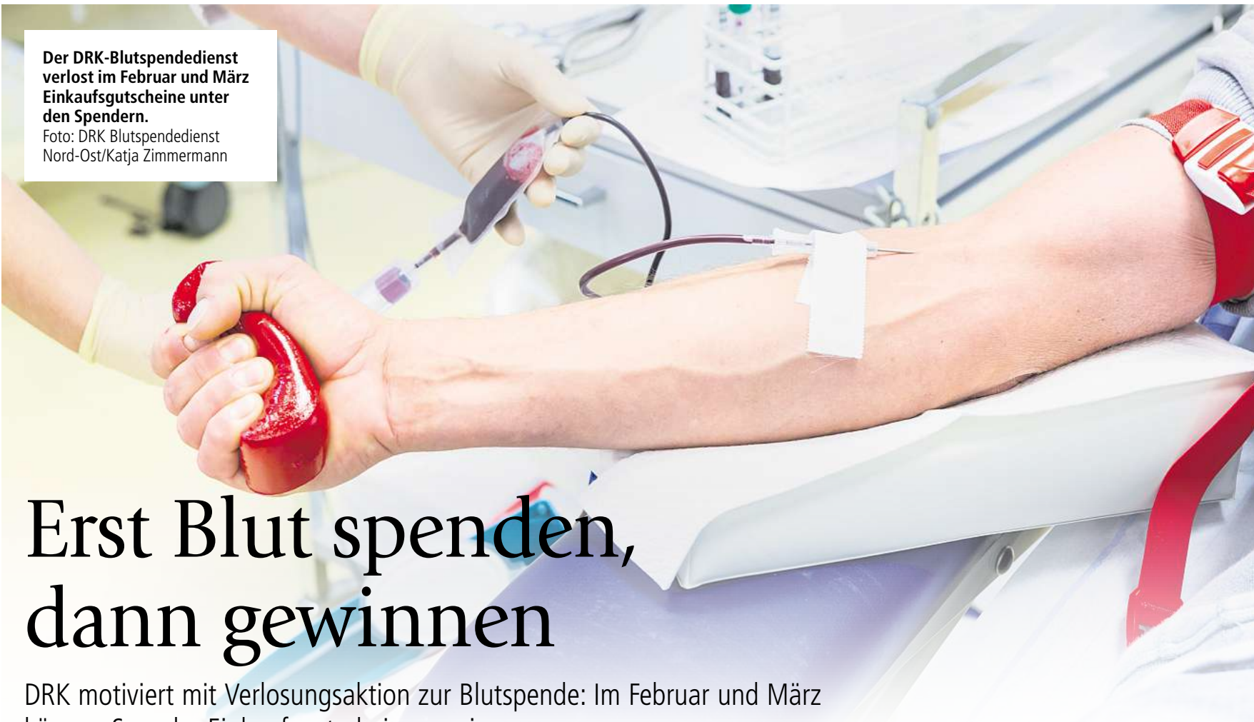
Der DRK-Blutspendedienst verlost im Februar und März Einkaufsgutscheine unter den Spendern.