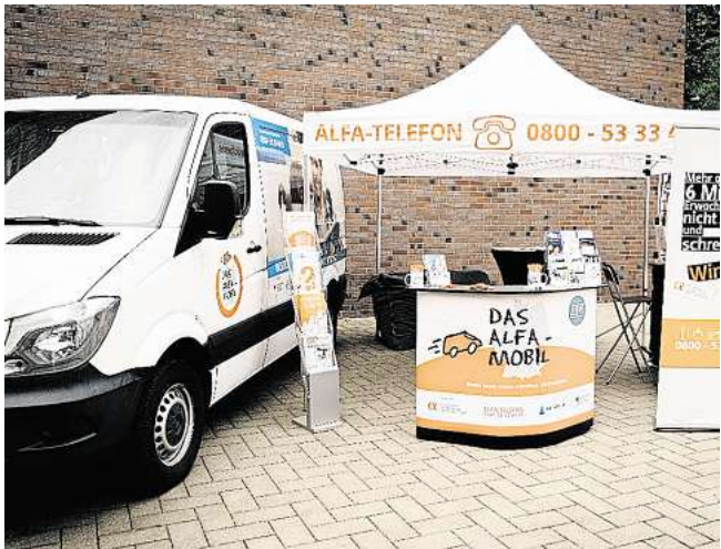
ALFA-Mobil des Bundesverbandes Alphabetisierung und Grundbildung e.V.

Hilfen bemüht und es geschafft, ein besonderes Angebot in die Region zu holen: das ALFA-Mobil des Bundesverbandes Alphabetisierung und Grundbildung e.V. (BVAG) wird am Montag, dem 28. April, nach Wittenberge kommen. Das ALFA-Mobil wird von 11 bis 15 Uhr am Edeka-Center, Lenzener Chaussee 21, stehen. „Viele Menschen sprechen uns spontan an und informie-