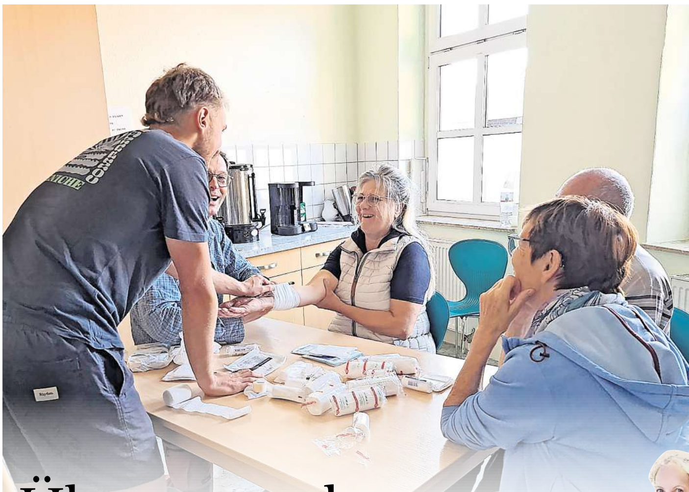
Teilnehmende üben beim Erste-Hilfe-Tag in Quitzöbel unter Anleitung von Rettungsprofis Reanimation und andere lebensrettende Maßnahmen.