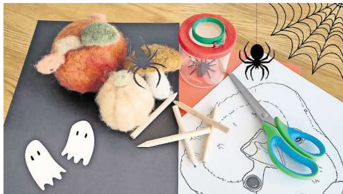
Gruseliger Spaß: Die Halloween-Party im Besucherzentrum Rühstätt.

Spiele wie „Monsterfangen“ und „Wettrennen der Spinnen“ für Stimmung. Um 17.30 Uhr beginnt ein Umzug durch das Storchendorf unter dem Motto „Süßes, sonst gibt's Saures“. Am Abend werden gesammelte Leckerbissen fair geteilt und der Tag klingt am Lagerfeuer aus. Das NABU-Besucherzentrum Rühstätt freut sich auf alle kleinen Geister. Die Veranstaltung ist kostenfrei. Anmeldung unter 038791/806555 oder info@nabu-ruehstaedt.de. WS