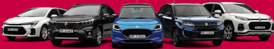
Abbildungen zeigen aufpreispflichtige Sonderausstattungen.