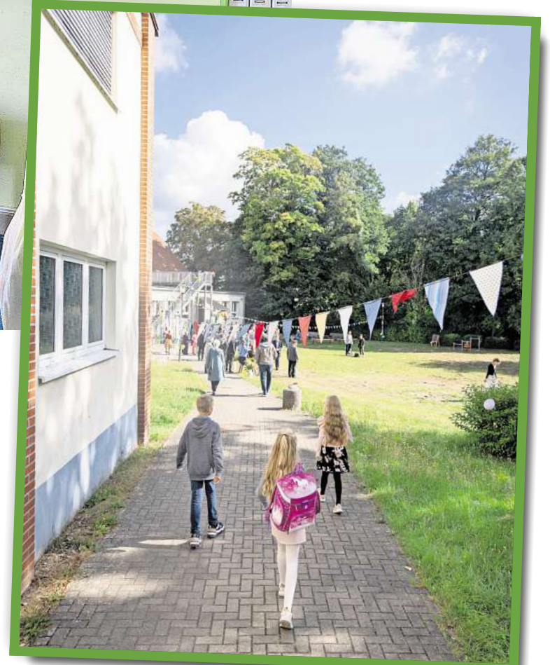
Der Umzug ist vollbracht – das neue Schuljahr ist am Perleberger Tor gestartet.