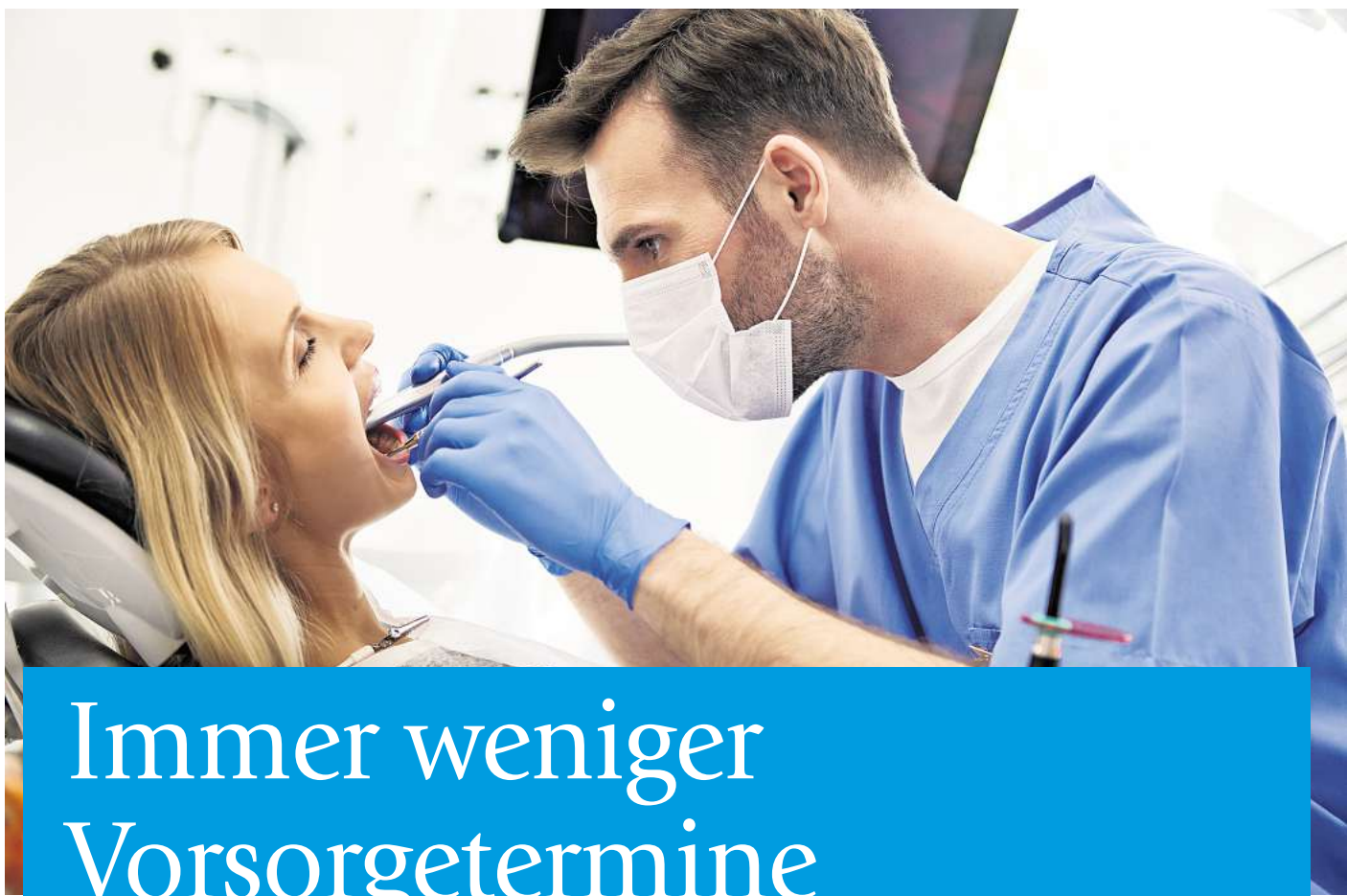
Eine regelmäßige Vorsorge kann Karies verhindern.