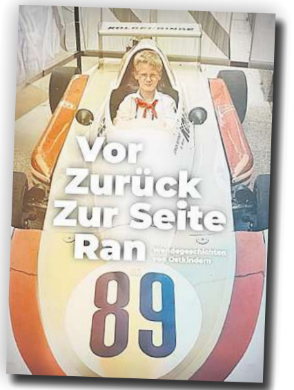
Der Dokumentarfilm „Vor Zurück Zur Seite Ran“ beleuchtet die Auswirkungen der Wendeereignisse auf das Leben von sechs Protagonisten.

Das Projekt wurde gefördert durch die Brandenburgische Landeszentrale für politische Bildung und realisiert mit Unterstützung der fotografischen Sammlung des Potsdam Museums – Forum für Kunst und Geschichte. Die Videographie setzte Victor Hanck um. Die Filmvorführung wird unter-