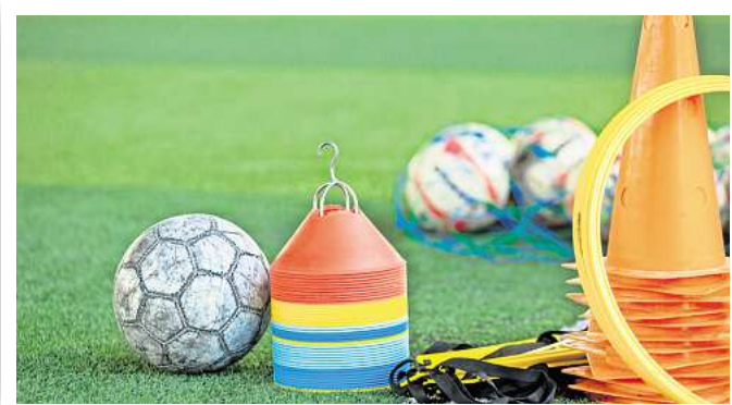
Sportler werden in Perleberg geehrt.

auf, der anschließend entsorgt werden muss.