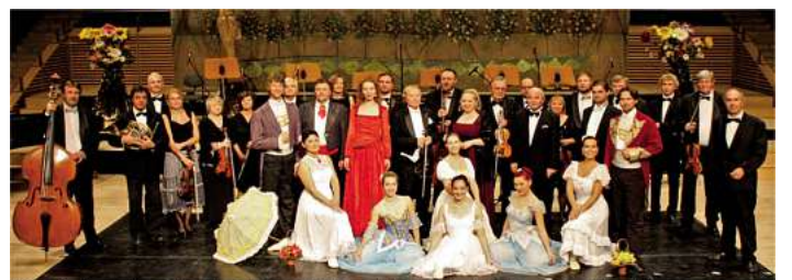
Mitglieder des GALA SINFONIE ORCHESTER Prag präsentieren unvergessliche Melodien der Väter der Operette