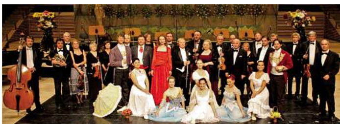
Mitglieder des GALA SINFONIE ORCHESTER PRAG präsentieren unvergessliche Melodien der Väter der Operette