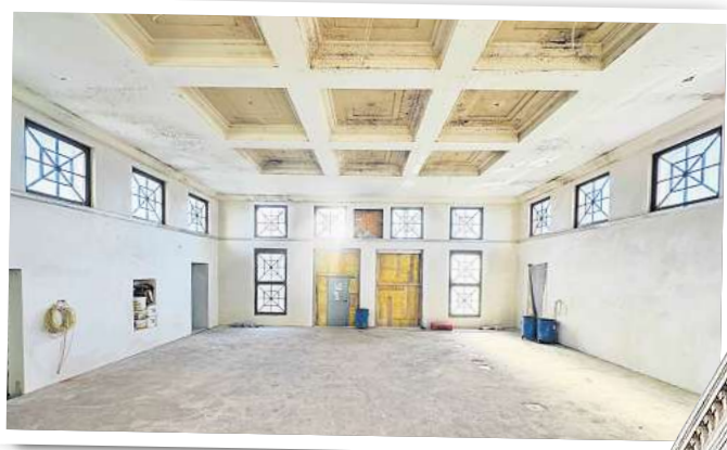
Das Bahnhofsgebäude in Wittenberge wird im Juni nach der Sanierung offiziell eingeweiht.

Am 13. Juni sollen das Bahnhofsempfangsgebäude sowie das Bahnhofsumfeld offiziell eingeweiht werden. Passenderweise lädt der angrenzende Historische Lokschiuppen am selben Wochenende zum „Sommerdampf“ ein. dre