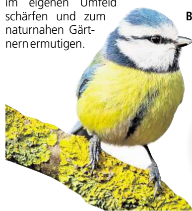
Blaumeise, Bunter Kugelspringer und Zitronenfalter.

PLATTENBURG/KLETZKE. Die Landfleischerei Hildebrandt in Kletzke hat zu ihrem diesjährigen 135-jährigen Firmenjubiläum im Februar eine Jubiläumstombola veranstaltet. Die Gewinner wurden nun von den Kindern der Kindersportgruppe Kletzke gezogen. Die Gewinner wurden schriftlich benachrichtigt. WS