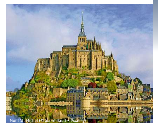
Mont St. Michel

Reiseveranstalter: PTI Panoramic4 Touristik International GmbH, Neu Roggentiner Straße 3, 18184 Roggentin/Vorbehaltlich Druckfehler und Zwischenverkauf