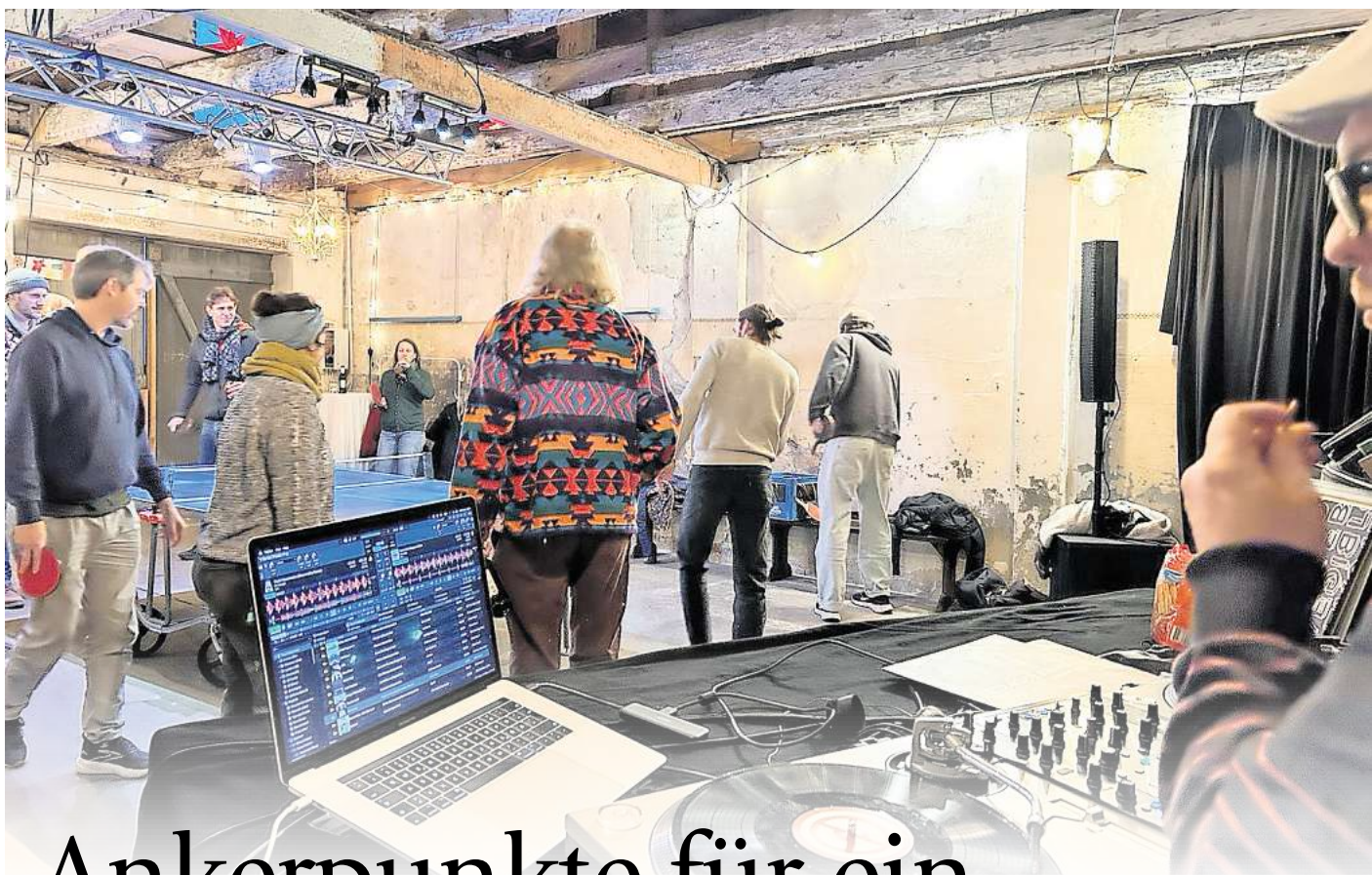
Ein offener Tischtennisabend ist der „Pong Club“ im Kulturkombinat Perleberg.