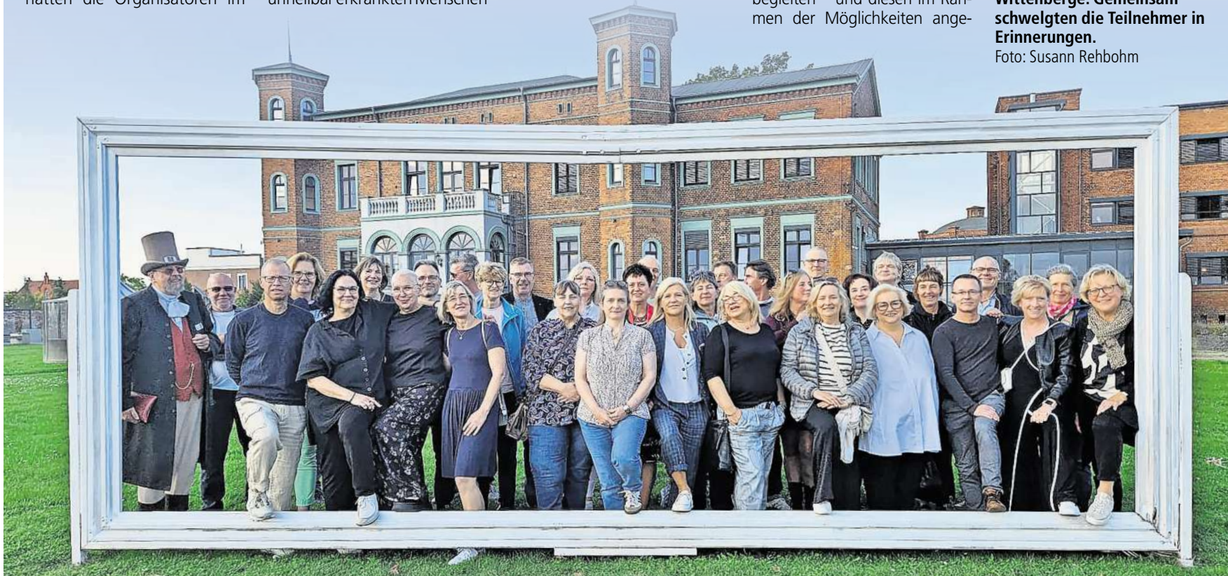
Treffen in der Alten Ölmühle Wittenberge: Gemeinsam schwelgten die Teilnehmer in Erinnerungen.

nehmen gestalten. „Wir unterbreiteten unseren ehemaligen Abiturienten den Vorschlag, den übrig gebliebenen Betrag dem Förderverein Prignitzer Hospiz e.V. zu spenden. Unser Vorhaben stieß auf positive Resonanz und gilt nun mehrstimmig als beschlossene Sache“, so Susann Rehbohm. „Es ist ein schönes Gefühl, dass wir uns auf diese Weise einbringen und den Förderverein Prignitzer Hospiz e.V. unterstützen zu können“, resümiert sie im Namen des Organisationsteams und des Jahrgangs. dre