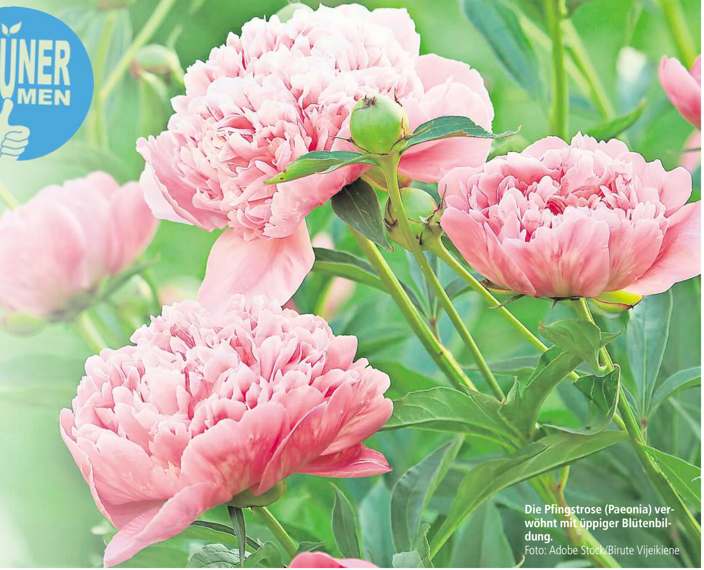
Die Pfingstrose (Paeonia) veröhnt mit üppiger Blütenbildung.