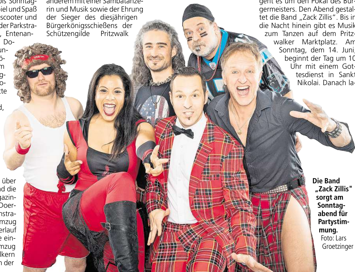
Die Band „Zack Zillis“ sorgt am Sonntag-abend für Partystimmung.

den noch einmal die Fahrgeschäfte und Versorgungsstände des Vergnügungsparks Alberti zum Familientag ein. Der Rummel ist am Sonntag bis 18 Uhr geöffnet.