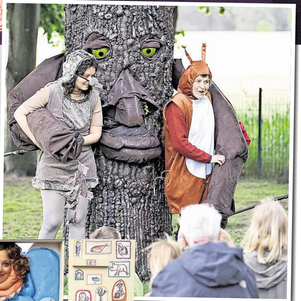
Das „Traumschiff-Theater“ bietet Mitmach-Spaß für Groß und Klein.

Ein besonderer Programmpunkt ist außerdem die Beteiligung des Medieninnovationszentrums Babelsberg (MIZ), das von Mittwoch bis Freitag mit einem Escape Room und einer Dialogstation zu Gast sein wird. „Die Festspielwoche 2026 zeigt einmal mehr, wie vielfältig Kultur in der Region sein kann. Mit ihrer Mischung aus professionellen Künstlerinnen und Künstlern, regionalen Akteuren, Mitmachangeboten und Konzerten schafft sie einen Ort der Begegnung für Menschen jeden Alters“, versprechen die Veranstalter. dre